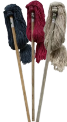
Trapeador de hilaza