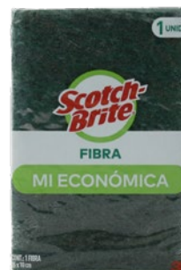
Fibra mi económica