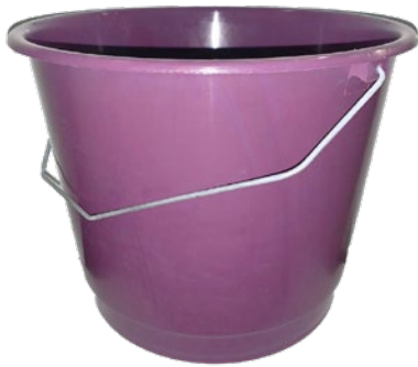
Cubo de 16 lts.