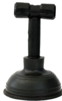
Mini Bomba para lavabo