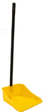
Recogedor de plástico